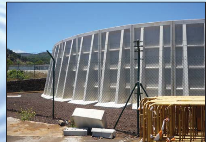
Estación de Bombeo El Helipuerto